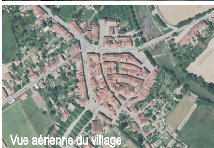
Vue aérienne du village